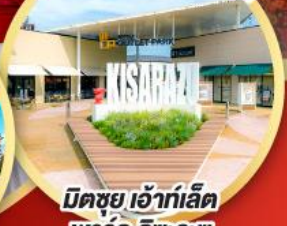
มิตซูย เอ้าท์เล็ต พาร์ค คิชะระชู